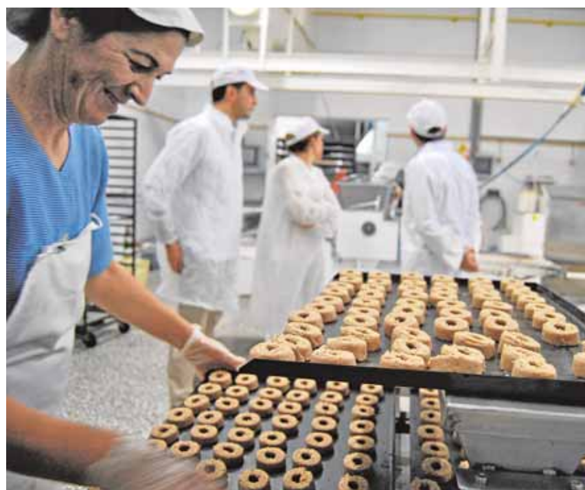
Algunas de las trabajadoras ya envolvían los dulces cuando eran niñas. ABC

Desde que la industria del mantecado y el polvorón diera sus primeros pasos en Estepa ha supuesto un apo-