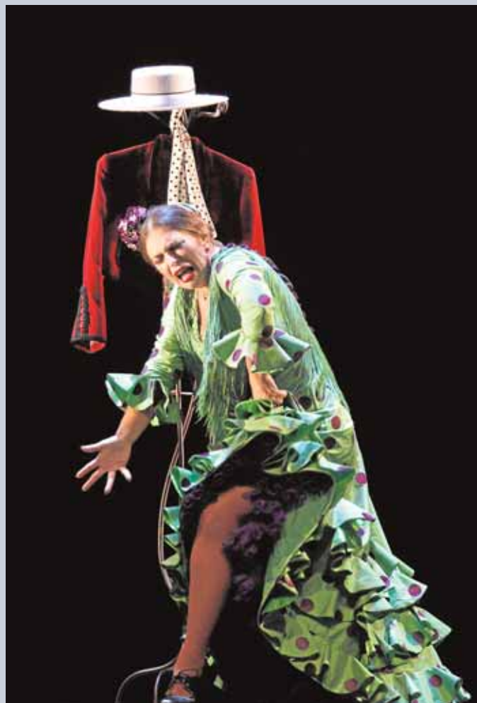
Pie de foto xxxxxxxxxxxxxxxxxxxx