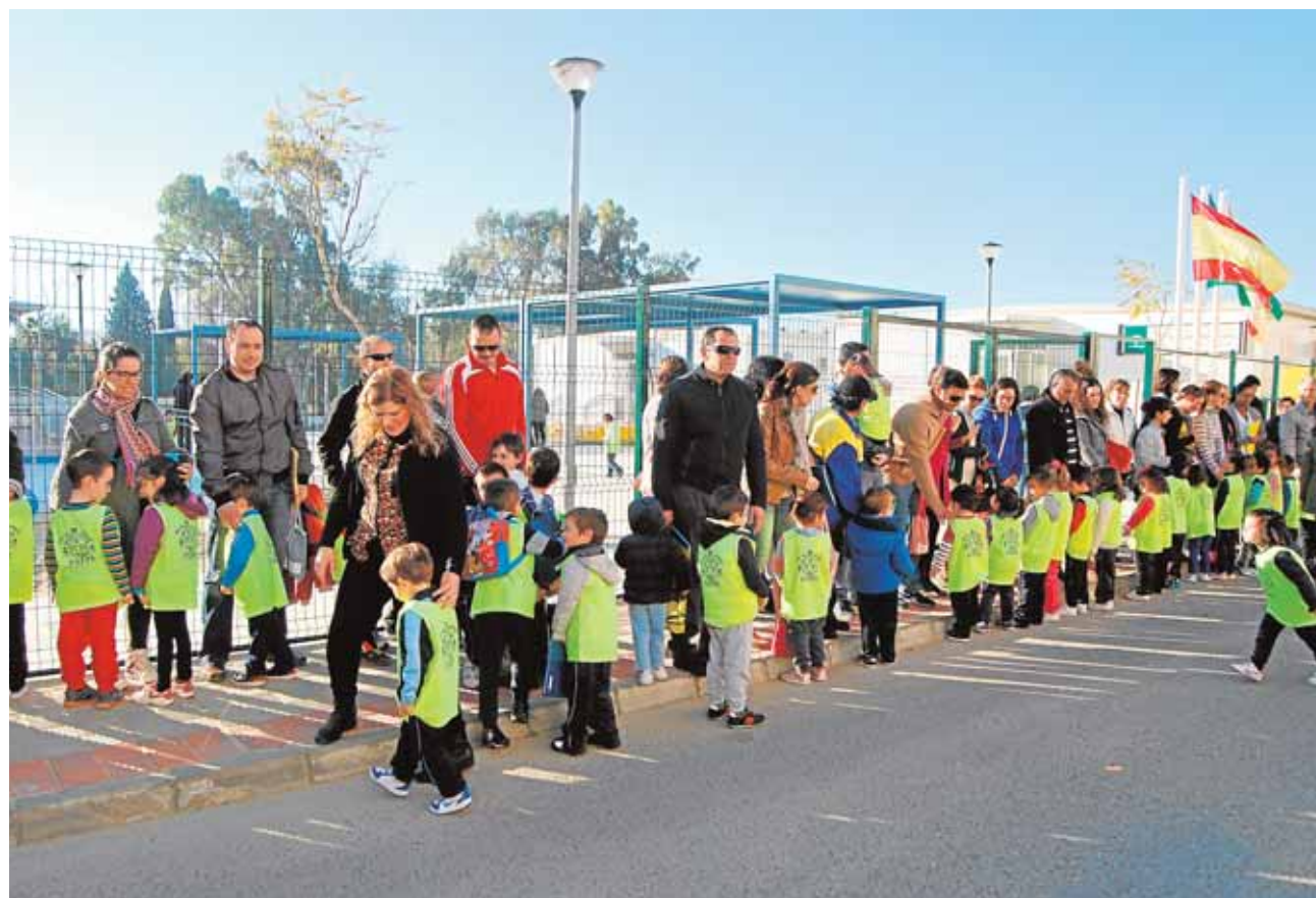
Los padres de Utrera han protagonizado el pasado curso movilizaciones contra las caracolas