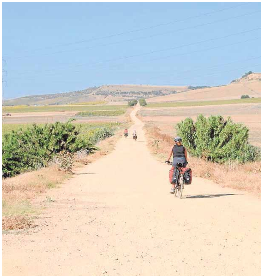
El Ayuntamiento quiere desarrollar las posibilidades de la Vía Verde A.M.

Por otro lado, el Ayuntamiento carmonense quiere recuperar la Vía Verde de Los Alcores, es decir el trazado