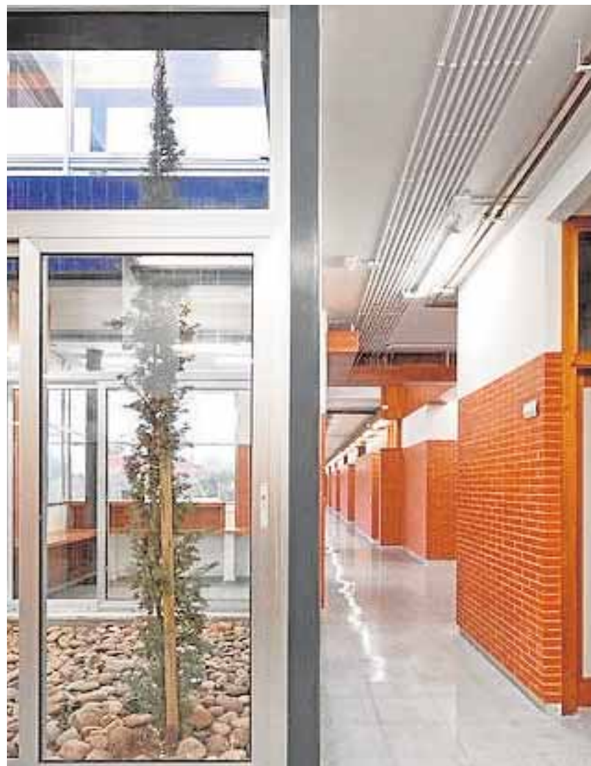
El IES Aníbal González se incorporará la próxima semana, con el inicio del nuevo curso escolar, a la red pública de centros bilingües de Andalucía

Además de en el IES Aníbal González, en este curso escolar se va a implantar el programa de bilingüis-