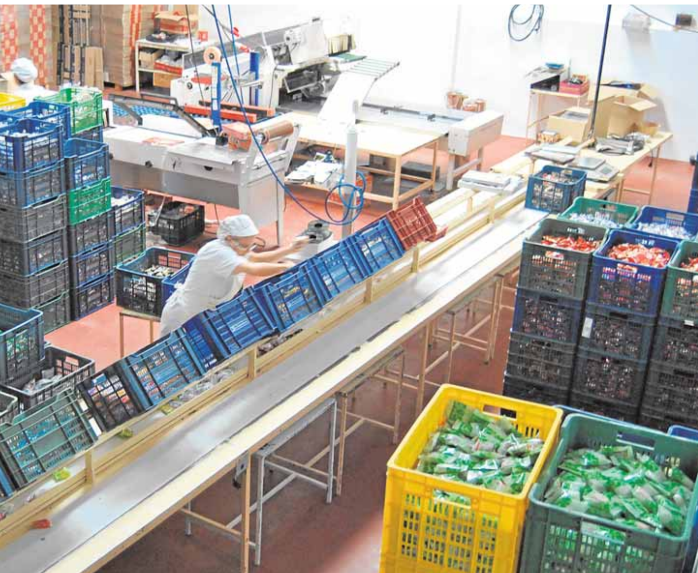
o de «La flor de Estepa», donde los primeros camiones salen cargados de mantecados y polvorones

vecina Pedrera. Desde el consistorio se reconoce que a pesar de los escasos recursos económicos de un pueblo con unos 3.800 vecinos, se ofrecen para prestar toda la ayuda y esfuerzos que sean necesarios para colaborar con los refugiados. B.M.