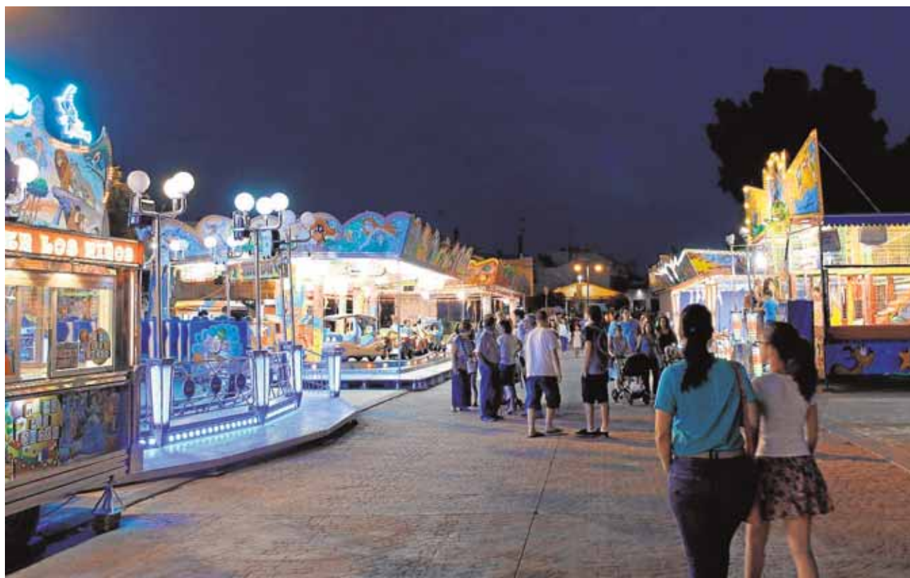
La feria contará con varias atracciones que funcionan desde el martes

de aceitunas en la Casilla Alcázar. La duración del empleo irá ligada a la recolección y según las necesidades de la misma. Las solicitudes se pueden presentar hasta el 15 de septiembre, y la selección de los peones será por sorteo el 23 de septiembre.