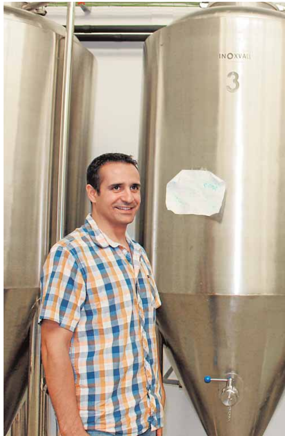
La fábrica de Cartujana en Fuentes de Andalucía tiene capacidad para producir 4.000 litros al mes.